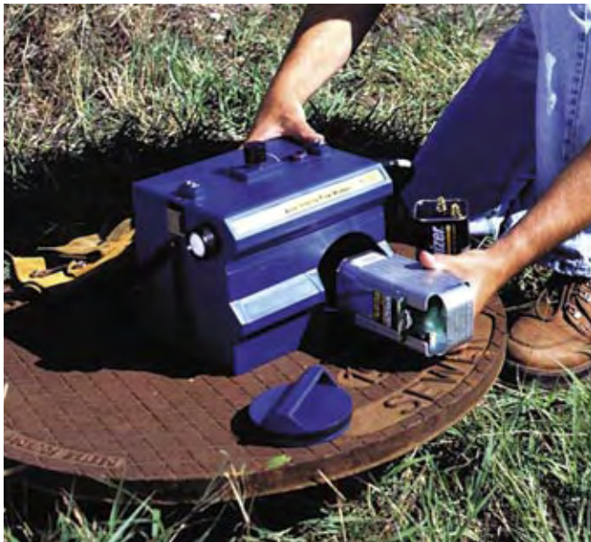
Dvě alkalické baterie poskytnou energii až na 15 měsíců měření.

Průtokoměr lze napájet z bateriového modulu 2191, který používá dvě alkalické baterie nebo dva nabíjecí olověné akumulátory. Vysoce hospodárný provoz průtokoměru ISCO 2150 zaručuje životnost baterií až 15 měsíců (dvě alkalické baterie při intervalu ukládání dat 15 minut). Spolu s měřenými hodnotami průtokoměr ukládá do paměti i napětí baterií, aby uživatel věděl, kdy je má vyměnit.