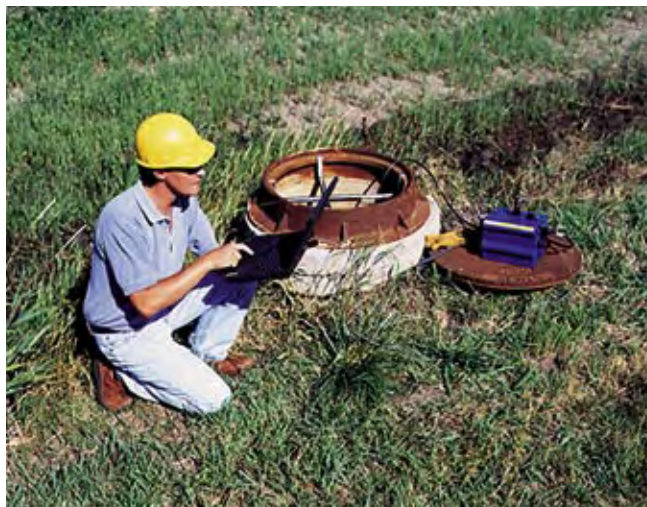
ISCO 2150 má vodotěsnou, odolnou konstrukci.

Průtokoměr ISCO 2150 je použitelný i v těch nejnáročnějších podmínkách. Je korozi odolný, prachotěsný a zcela vodotěsný. Má mechanické krytí IP68 (vodotěsný i při delším ponoření).