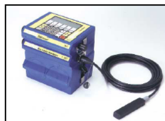
Fotografie zobrazuje přímé připojení Field Wizardu na modul 2150. Dolní fotografie ukazuje možné propojení prodlužovacím kabelem